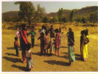
कातकरी वस्तीवरील दल