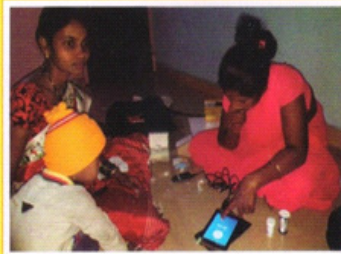
टेलीमेडीसीन प्रकल्पांतर्गत तपासणी करताना