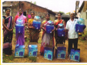
स्वावलंबी गाव प्रकल्पातील फिल्टर वाटप