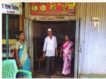
डेली कलेक्शन मधून छोट्या उद्योजकांना अर्थसहाय्य