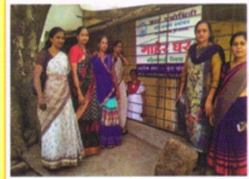
एकल महिलांसाठी माहेरघर