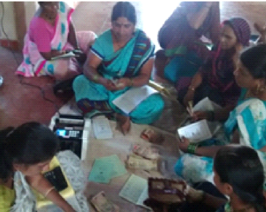
नोटा तपासणारे व मोजणारे यंत्र गावोगाव वेळापत्रक लाऊन नेले. मशीनवर नोटा कशा मोजायच्या हे महिला जबाबदारीने शिकल्या

ज्या गटांची कर्जफेड बाकी आहे त्या गटातल्या सदस्यांनी बँकेतले व्यवहार कमी संख्येत व्हावेत म्हणून शक्यतो एकरकमी गटाची कर्ज फेड आधी करावी असे सुचवले म्हणजे २० जर्णीच्या २० बचत खात्यात डिपॉझिट एन्ट्री करण्या ऐवजी १ एन्ट्री करून २० जर्णीकडचे बाद चलन बँकेत जमा होऊन सगळ्यांचे काम होईल.